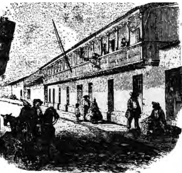
Figura 4. Casa don Juanito Mora (ubicada en la actual Avenida 2. a ) en 1858. Dibujo de Ramón Páez.

Rohrmoser, después en casa del doctor Montealegre) 53 , y Hotel Inglés, de Cauty, en casa del doctor José María Castro Madriz (hoy Correo) 54 . Sus precios corrientes eran de 1¼ a 1½ pesos diarios por habitación y comida; por meses, de 30-40 pesos; las horas de almuerzo y comida eran las 9 y las 3. Criados y criadas ganaban 5 pesos, término medio 55 .