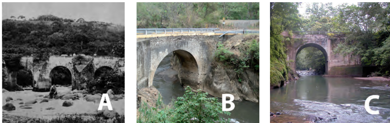
Figura 5. Tres puentes importantes en lo que fuera el Camino Nacional, hacia Puntarenas, sobre los ríos Virilla (A), Grande de Tárcoles (B) y Jesús María (puente de las Damas) (C).

Antes de abrir Limón con su vía férrea 72 , todo el comercio se hacía por Puntarenas (el viaje por Sarapiquí se había acabado pronto, por lo costoso) y en el verano era admirable el movimiento, viéndose a veces en el golfo de Nicoya, frente al muelle, dos y tres vapores y hasta cinco veleros embarcándose hasta 200 000 sacos de café. Hubo día, en Semana Santa, de juntarse trescientas carretas con café, llenando las calles de Piedra y Estero de lado a lado.